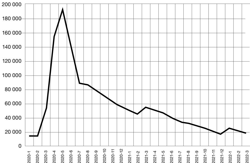
Kuvio 1. Lomautetut 1/2020–3/2022, henkilöä (kausitasoitettu)

Naisten ja miesten väliset erot työttömyydessä eivät olleet merkittäviä. Aloilla, joissa irtisa-